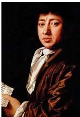
Samuel Pepys (1633 – 1703)

fatica le addizioni e le sottrazioni e financo le moltiplicazioni. Ma io non oso turbarla ancora con la pratica delle divisioni».